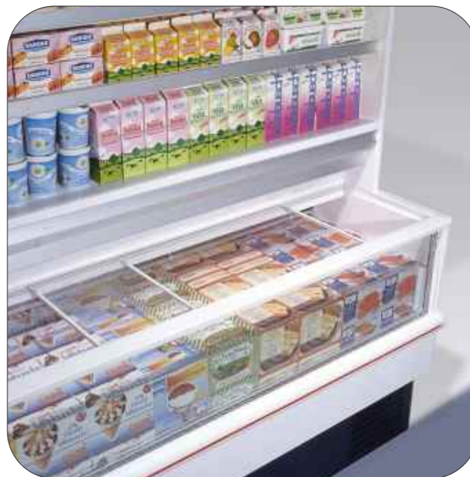
Con scorrevoli - With sliding panels Avec panneaux coulissants - Mit schiebetüren Con paneles correderos - Com painéis correderos

Versatilidade de uso no ponto de venda, ótima apresentação merceológica, performance elevada com consumo limitado, são as principais características do SYMPHONY ABT e SYMPHONY ATN. O SYMPHONY ABT, com cuba e superestrutura com portas a baixa temperatura, destina-se à conservação e exposição de gelados e de produtos congelados. O SYMPHONY ATN permite diversificar a oferta de produtos: a cuba a baixa temperatura – com painéis correderos que melhoram o desempenho e contém os consumos – permite conservar e apresentar gelados e produtos congelados. A superestrutura com prateleiras é a temperatura normal, ideal para produtos frescos embalados e bebidas. O sistema de refrigeração a R404a permite obter excelentes desempenhos respeitando plenamente o ambiente. Disponíveis também versões sem grupo incorporado. A qualidade é garantida pela certificação ISO 9002.